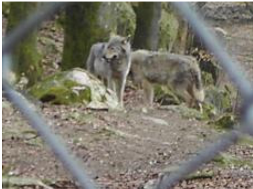
Bild 2. Är det bara så här vi vill se vargen i framtiden, bakom stängsel? Foto taget i Skånes Djurpark 060424.