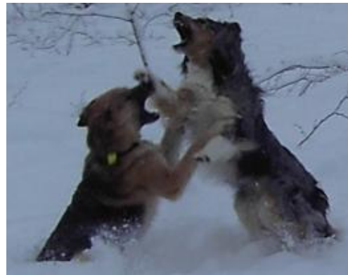
Bild 1. Lek eller allvar? Genom leken får individen bland annat sin plats i flocken, både hos hund och varg.

Och knappt hade vargen sagt det, förrän han tog ett språng ur sängen och slukade Rödluvan." 1