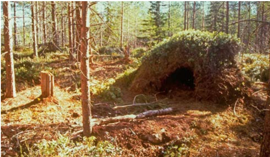
Utgrävt ide i en gammal myrstack.